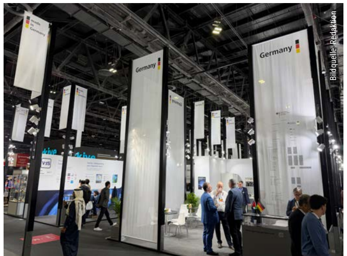
Der deutsche Pavillon betreute über 50 Unternehmen aus der Bundesrepublik.