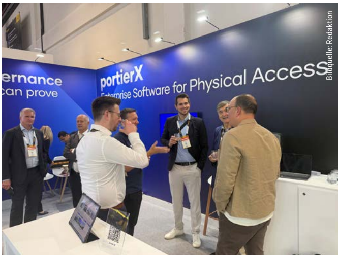
Im Rahmen einer Feierstunde wurde die neue Version X von Portier gelauncht.

punkt der internationalen Fachwelt deutlich. Dies ist eine neue globale Gruppe in Kooperation mit der Access Control Collective (TACC) für Sicherheitsfachgeschäfte, die Mitglieder der Verbände der European Locksmith Federation (ELF) und der Associated Locksmiths of America (ALOA) sind. Ziel der Gemeinschaft ist es, die Vernetzung im Bereich der physischen Sicherheit zu stärken und den Wissensaustausch über verschiedene Rollen, Disziplinen und Regionen hinweg zu fördern – sowohl in Präsenz als auch online. Alle Mitglieder, die sich stärker mit elektronischen Schließsystemen, Smart Locks und drahtlosen Schließsystemen auseinandersetzen sowie enger mit Herstellern zusammenarbeiten möchten, um deren elektronische Schließprodukte zu installieren und zu warten, sind dort willkommen.